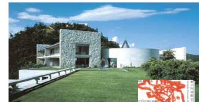
香川県直島 ベネッセハウス

■瀬戸内国際芸術祭(直島)を視察 芸術を活用した誘客について、3年に1度の芸術祭。前回は108日間で107万人を動員。