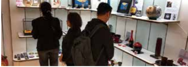
香港市内の石川県アンテナショップ視察