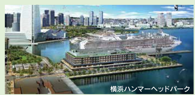
横浜ハンマーヘッドパーク

土木部長 クルーズターミナル周辺の土地利用を見直すには、分区の設定や用途地域の変更といった手法がある。他港の状況を含め勉強したい。