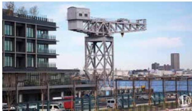
英国製ハンマーヘッドクレーンがシンボル

新湊ふ頭客船ターミナル・横浜ハンマーヘッド 大型客船ターミナルと食をテーマとした商業施設、ホテルを併設した複合施設