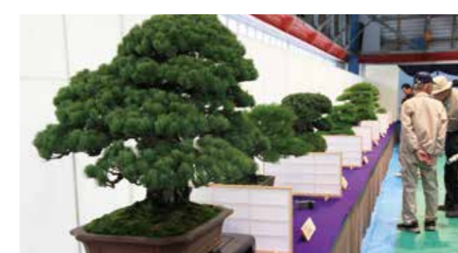
高松盆栽を世界にPRする取り組み

■JETRO(ジェトロ)香川を視察 香川県の盆栽生産量は全国の80%を占める。海外で盆栽が日本の芸術文化として高く評価され、人気が高まる一方で、国内市場は縮小傾向にあり、盆栽の海外販路開拓を支援している。