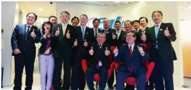
香港の大手旅行会社「EGL Tours」訪問

令和元年11月7日(木)～13日(水) (香港・タイ) 小松空港国際化推進石川県議会議員連盟 香港・タイ訪問