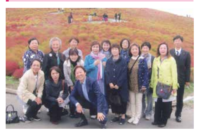
コキアカーニバル開催中の国営ひたち海浜公園にて

令和元年10月15日(火)16日(水) (茨城県・福島県) 金沢みなと懇話会女性部会研修視察