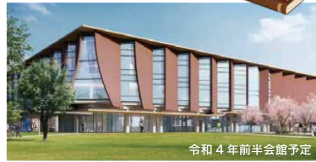
令和4年前半会館予定

本を開いた状態をイメージした外観だけにテッドスペースも多いかと思いきや至るところに読書スペースを設け、いい意味でニッチ利用されている。解放的な館内だけに声など反響しないか?こちらも工夫が凝らされて心配ないとの事。本が入ったらまた大きく感じも変わると思うので楽しみです。近年開館した県立図書館ではトップクラスとなる約30万冊を開架予定。