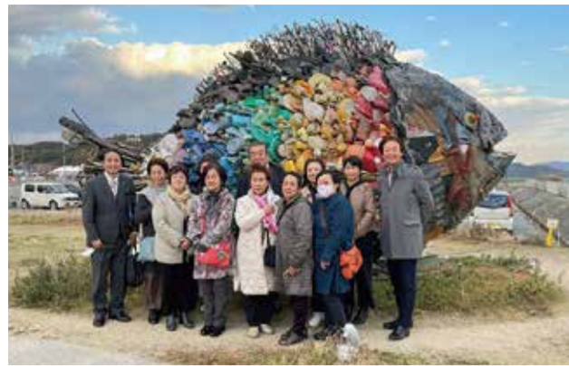
「みなとオアシス宇野」の宇野のチヌ(淀川テクニック)

令和3年11月26日(金)27日(土) (広島県・岡山県) 金沢みなと懇話会女性部会研修視察